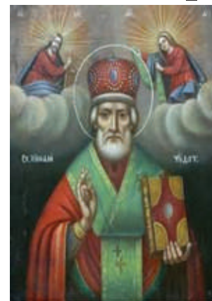
San Nicolas de Myra