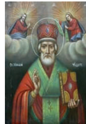
San Nicolas de Myra